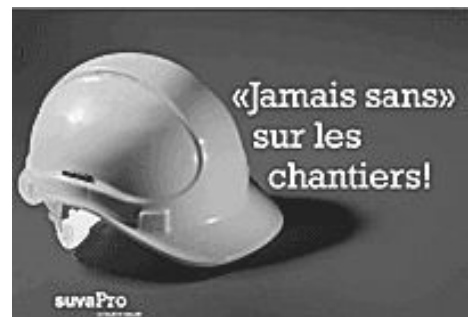
Les règles de sécurité suisses et locales doivent être appliquées. En cas de différence entre celles-ci, on se soumettra à la règle la plus protectrice pour le collaborateur.