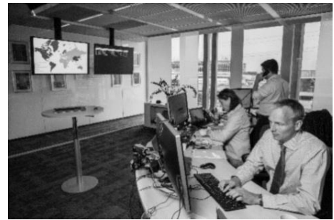
Plateau d'assistance médicale et sécuritaire.