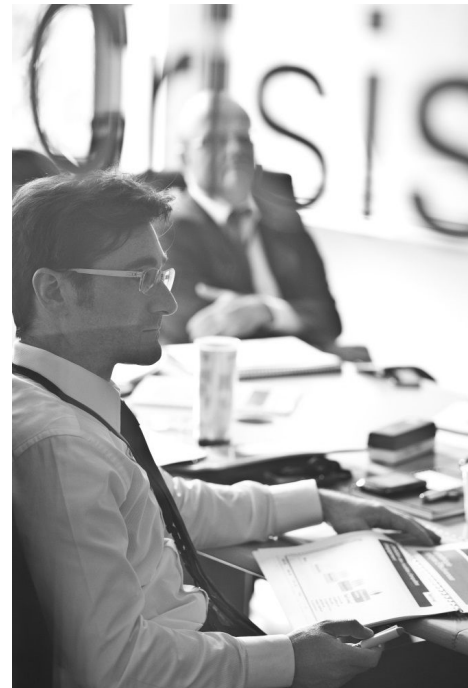
Mettre en place une cellule de crise, même réduite à un piquet autour d'un téléphone, est un élément primordial de sécurité à tous les niveaux.